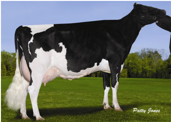
STANTONS LUCKY CAMEO FIFTH DAM