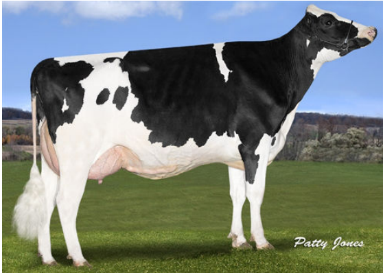
STANTONS CAMEO APPEARANCE GRANDDAM