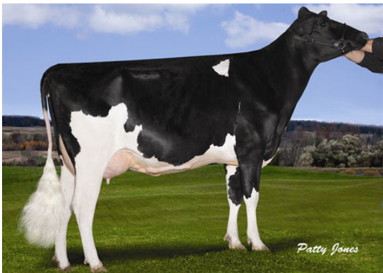
STANTONS FREDDIE CAMEO FOURTH DAM